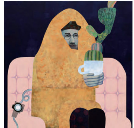
5am, Electric blanket and a cup of cactus

2011年：「The Pratt Harlem Project」 228 0 Frederick Douglass Blvd (ニューヨーク)