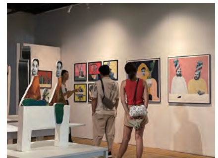
AAME Awardee show