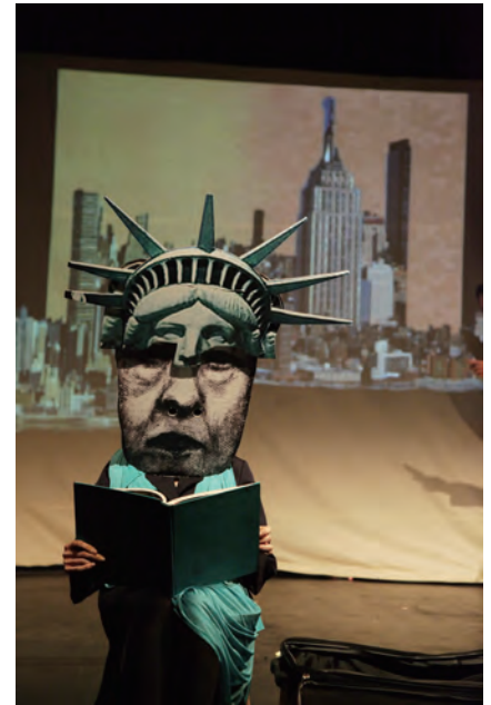
No-Need-For-a-Night Light On A Light Night Like Tonight