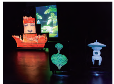
Daydream Anthology