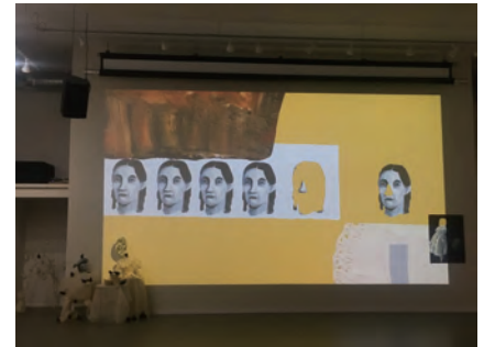
Jamestown Art Center