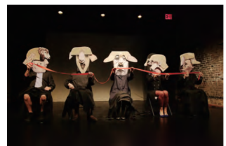
No-Need-For-a-Night Light On A Light Night Like Tonight