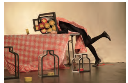
No-Need-For-a-Night Light On A Light Night Like Tonight